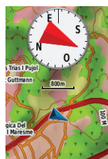
Procesador de trayecto